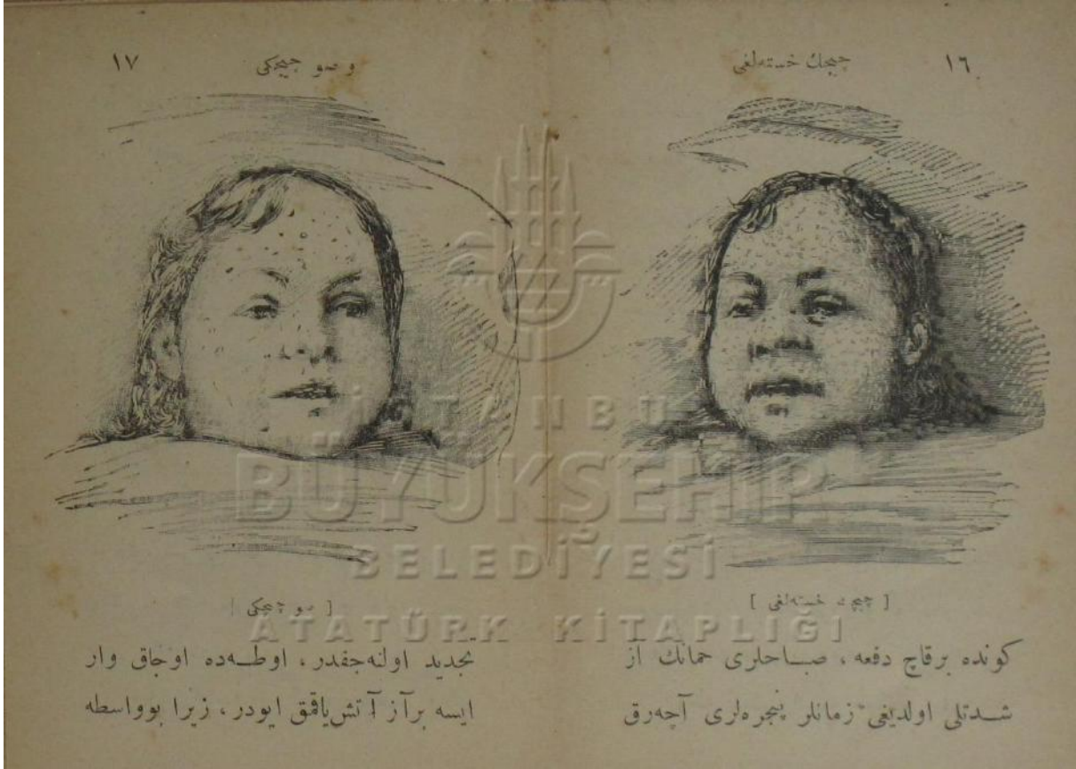
(Doktor Besim Ömer, Çiçek Hastalığı ve Suçiçeği , Âlem Matbaası, Kostantiniyye 1310, ss. 16-17.)